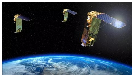
Système CERES de satellites dédiés au renseignement