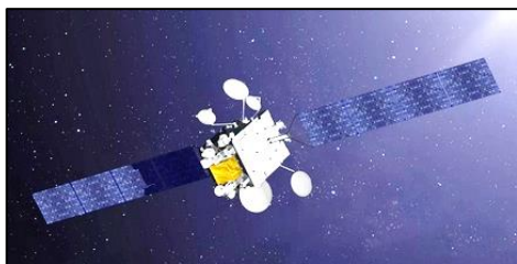
Système Syracuse de satellites dédiés aux télécommunications.